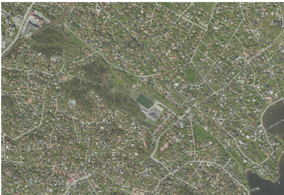
Figur 1: Vy över Grängsgärdets utbredning

Majoriteten av detaljplanerna inom Grängsgärdet anger att områdena ska användas som park, plantering, lek och idrottsplats med undantagsfall från fyra mindre områden i två av detaljplanerna som anger kraftledningar, högspänningsledning och transformatorstation. Kommunen är ägare till samtliga fastigheter inom Grängsgärdet och har redan idag en aktiv skötsel av ytorna med hänsyn till biologisk mångfald. Då kommunen är ägare till samtliga fastigheter inom Grängsgärdet och majoriteten av detaljplanerna redan skyddar områdets grönstruktur skulle en ny detaljplan inte ge någon större skillnad i förbättrat skydd jämfört med de redan befintliga detaljplanerna.